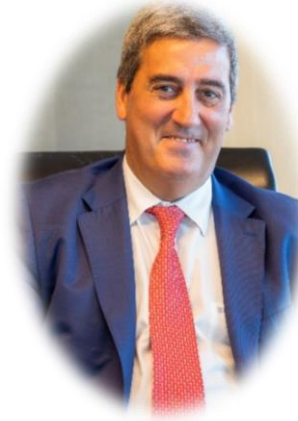
Xabier Basañez, Presidente de AFE